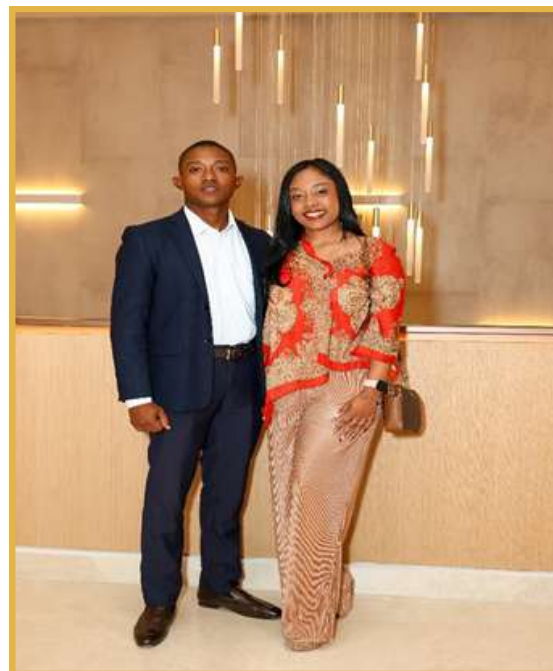
Socias e Invitados