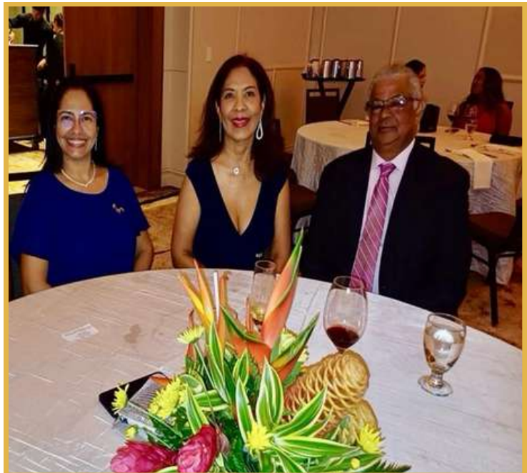
Socias e Invitados