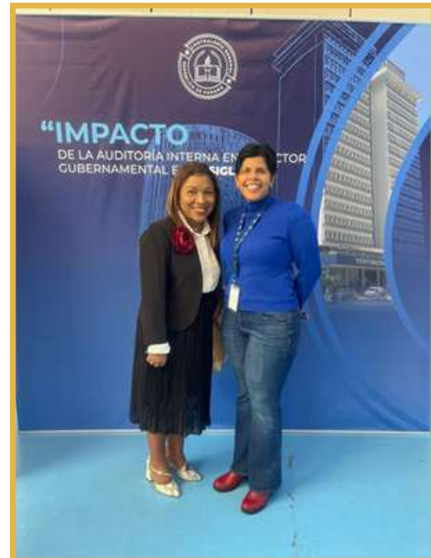
Conferencia sobre impacto de la auditoria interna en el sector gubernamental en el Siglo XXI