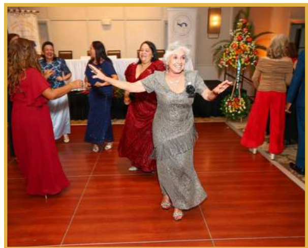
Socias e Invitados