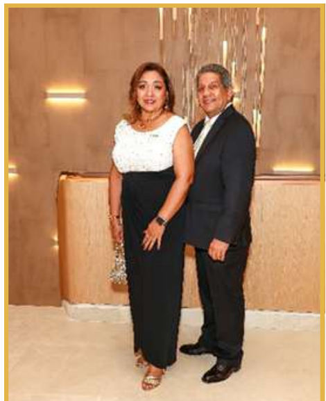
Socias e Invitados