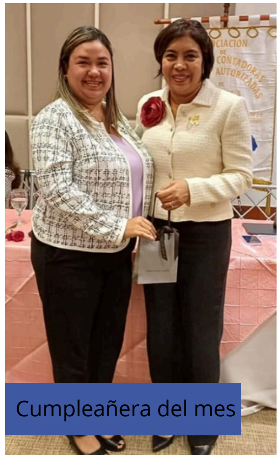
Cumpleañera del mes