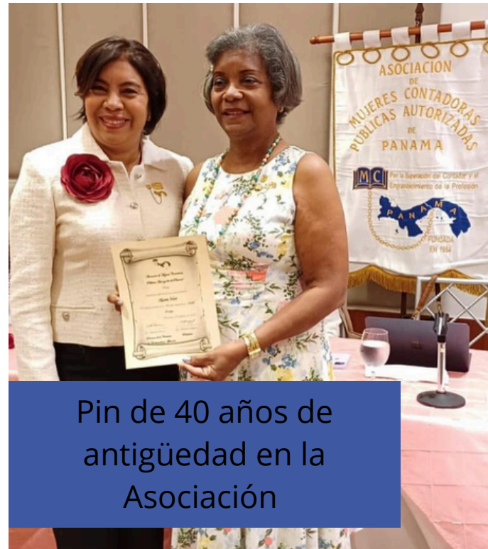
Pin de 40 años de antigüedad en la Asociación

Se celebró a nuestras socias cumpleañeras del mes con un obsequio, al igual que a quienes destacaron por su asistencia. y Certificado y Pin de antigüedad.