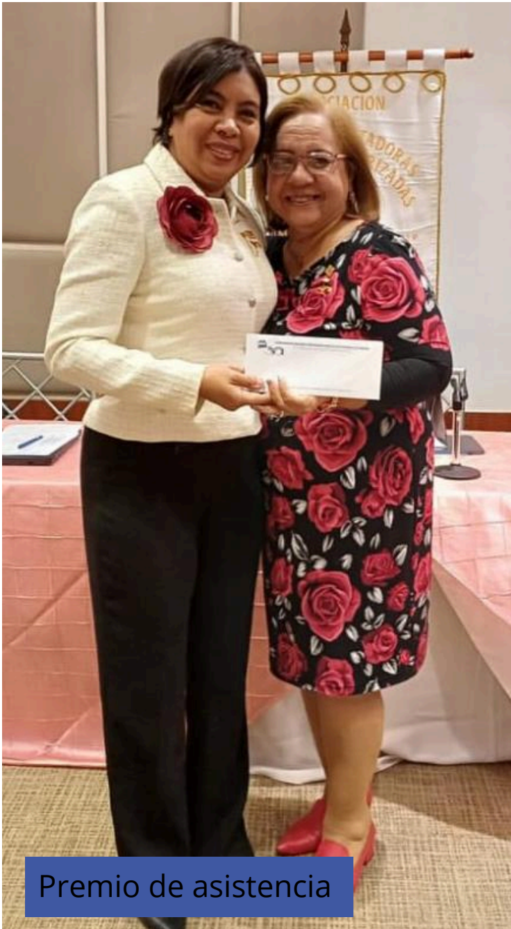
Premio de asistencia

Se celebró a nuestras socias cumpleañeras del mes con un obsequio, al igual que a quienes destacaron por su asistencia. y Certificado y Pin de antigüedad.