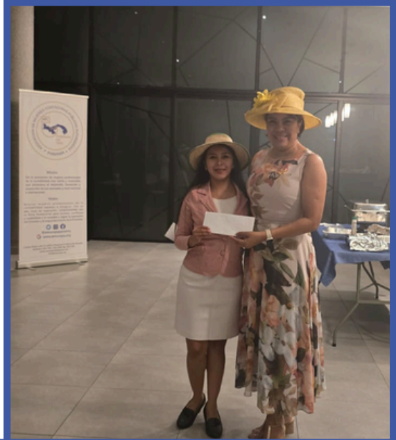
Ganadora del 2do. Lugar "Mejor sombrero AMUCOPA"