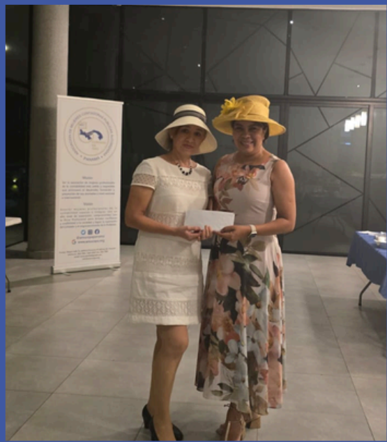
Ganadora del 1er. Lugar "Mejor sombrero AMUCOPA"