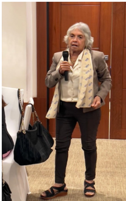
Código de Ética Licda. Vielka Chiari